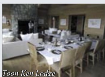
Toon Ken Lodge