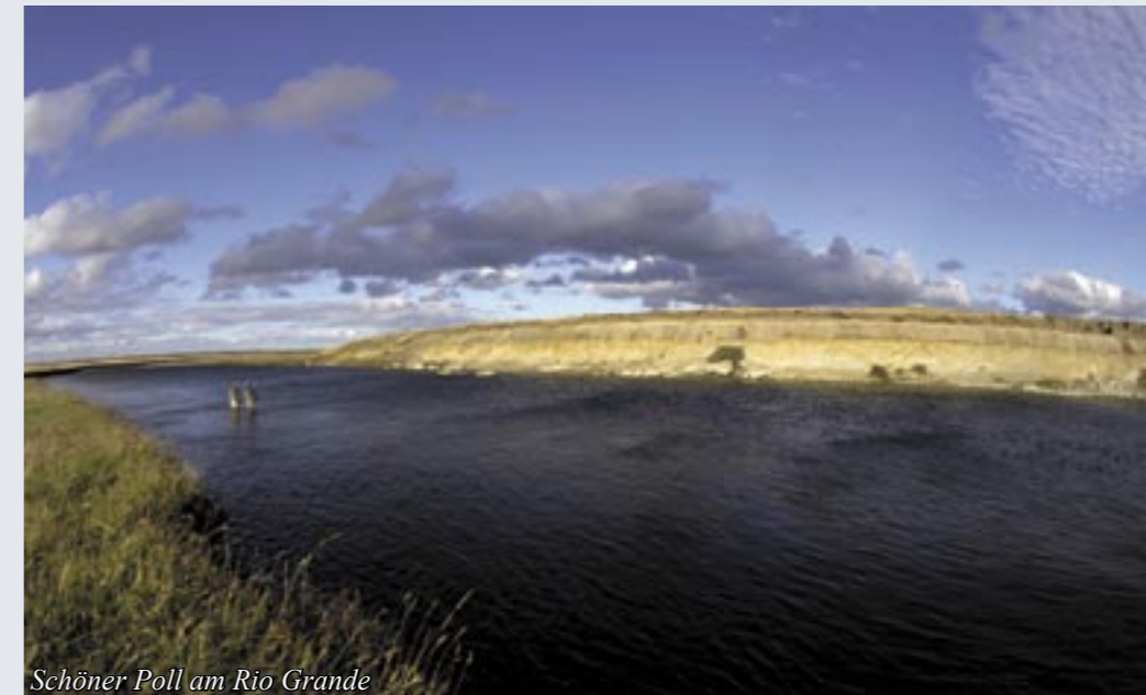
Schöner Pool am Rio Grande

Die Kau Tapen Lodge ist die älteste und exklusivste Lodge am Rio Grande. Sie verfügt über die ergiebigsten Pools. Die