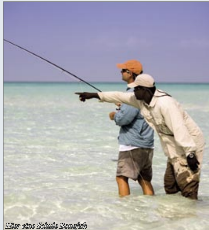
After eine Schule Bonefish