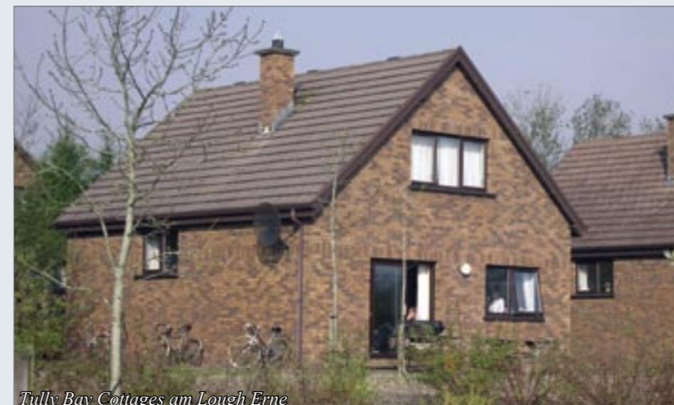
Tully Bay Cottages am Lough Erne

Hochseefischen kann man von Killibegs oder Mullaghmore aus an der Bay of Donegal. In beiden Häfen können Privat- oder Gruppen-Charter gebucht werden. Es bietet sich eine grosse Auswahl an Fischen an: Kabeljau, Dorsch, Lengfisch, Brasse, Polack, Hundshai und Makrele.