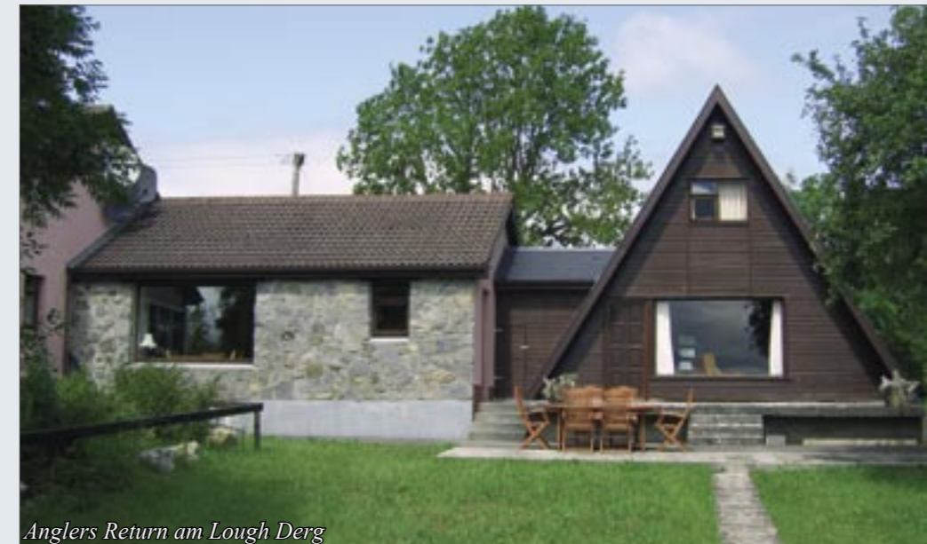
Anglers Return am Lough Derg

Wenn es auf dem See zu windig ist, braucht