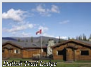
Dalton Trail Lodge