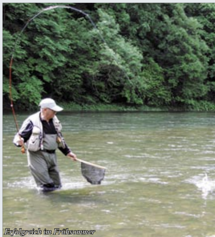
Erfolgreich im Frühsommer