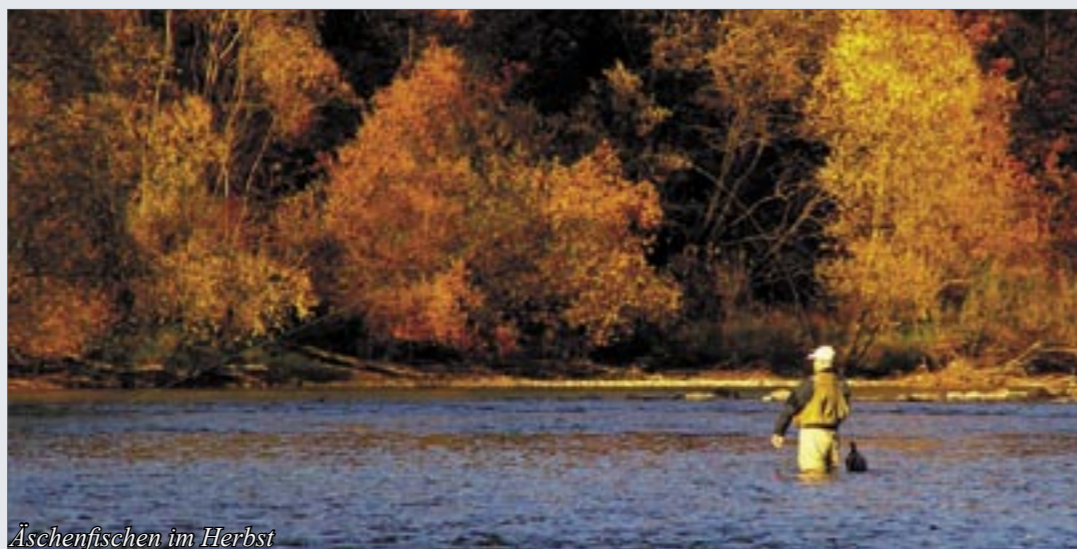
Äschenfischen im Herbst

Am San River im Südosten Polens wurden schon mehrmals Europa- und Weltmeisterschaften im Fliegenfischen durchgeführt. Das sagt einiges über die Qualität der Fischerei aus. Wer das klassische Fliegenfischen mit leichtem Gerät auf wilde Äschen und Bachforellen in natürlicher Flusslandschaft liebt, kommt hier auf seine Kosten.