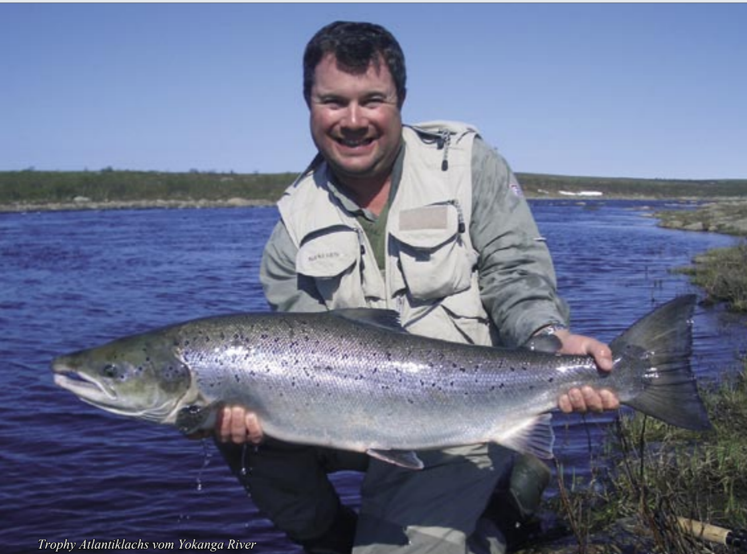
Trophy Atlantiklachs vom Yokanga River